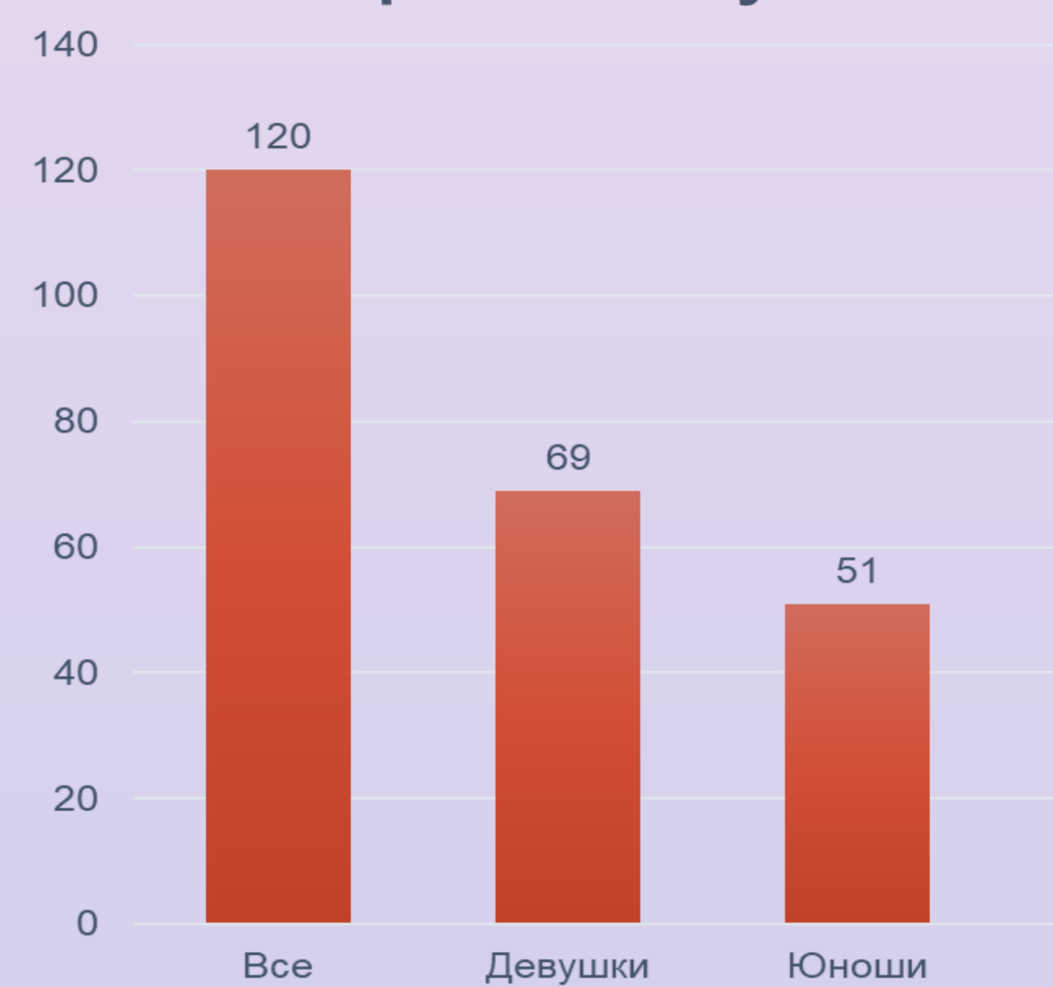
Количество студентов, принявших участие