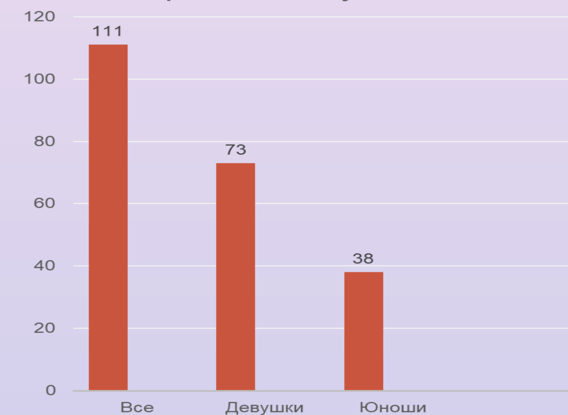
Количество студентов, принявших участие